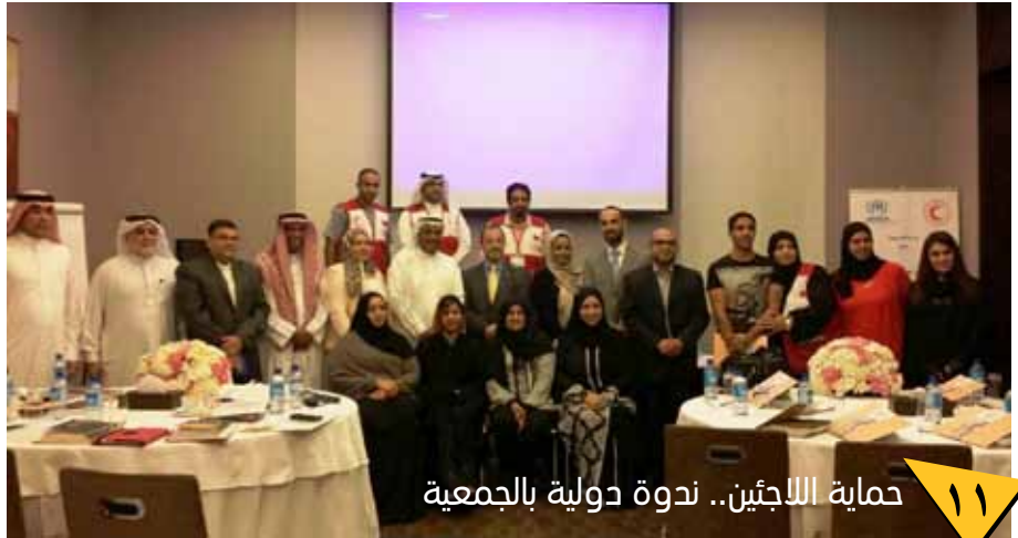
حماية اللاجئين.. ندوة دولية بالجمعية