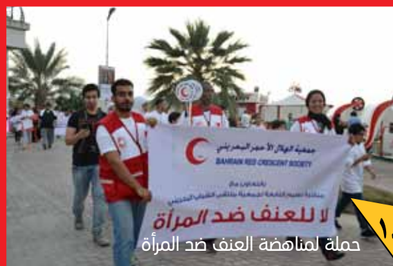
حملة لمناهضة العنف ضد المرأة