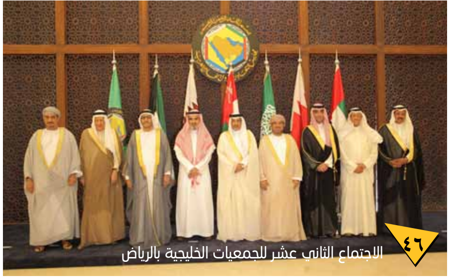
الاجتماع الثاني عشر للجمعيات الخليجية بالرياض

مركز الخدمات الإعلامية هاتف: ١٧٣٤٦٦٧٤ - فاكس: ١٧٣٤٦٦٧٨ البريد الإلكتروني: mediaser2@gmail.com