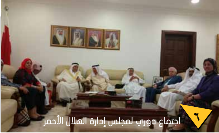
اجتماع دوري لمجلس إدارة الهلال الأحمر

العدد العشرون - رمضان 1437 هـ - يونيو 2016 م