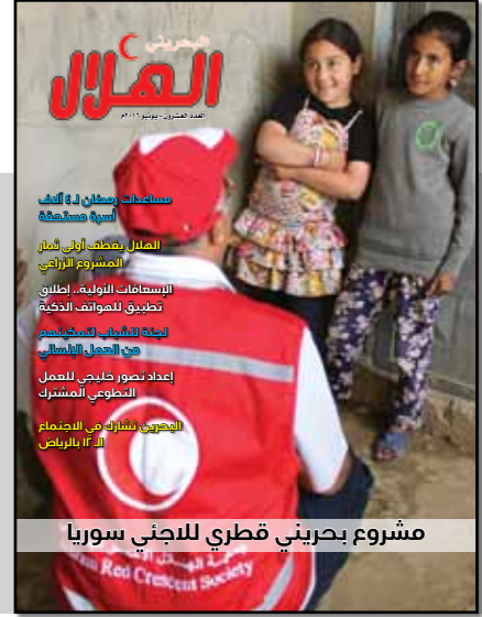
مشروع بحريني قطري للاجئين سوريا

العدد العشرون - رمضان 1437 هـ - يونيو 2016 م