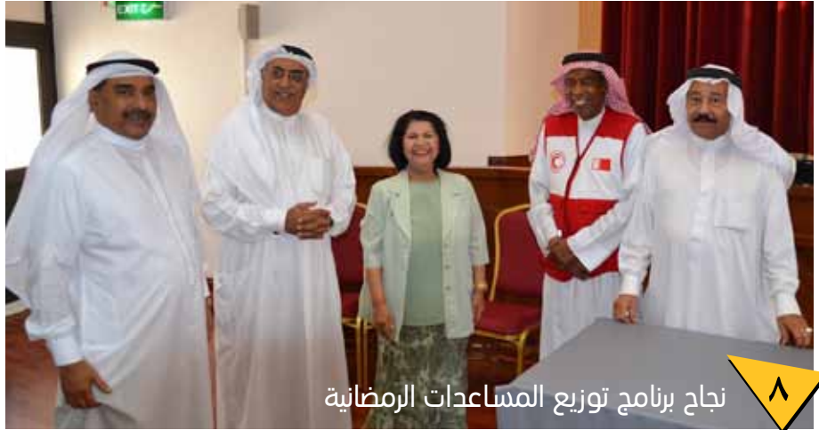
نجاح برنامج توزيع المساعدات الرمضانية