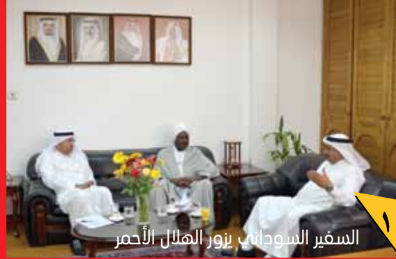
السفير السوداني يزور الهلال الأحمر

قادة ومنظمات العالم اجتمعوا في إسطنبول في قمة غير مسبوقة لتحسين نهج التعامل مع الأزمات الإنسانية ومع ٦٠ مليون نازح و١٢٥ مليون شخص محتاج.