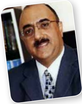
بقلم: د. فوزي أمين الأمين العام

وفي كل أدوارنا الاجتماعية الوطنية، والإنسانية الدولية، يعتمد الهلال الأحمر البحريني نهج الشراكة مع القطاعين الحكومي والخاص، وهو ما نعتبره ضماناً لقافلة الإنجازات التي لن نتوقف بمشيئة الله.