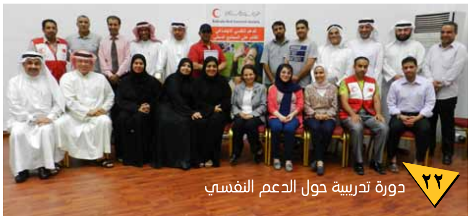
دورة تدريبية حول الدعم النفسي