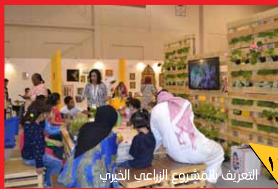
التعريف بالمشروع الزراعي الخيري