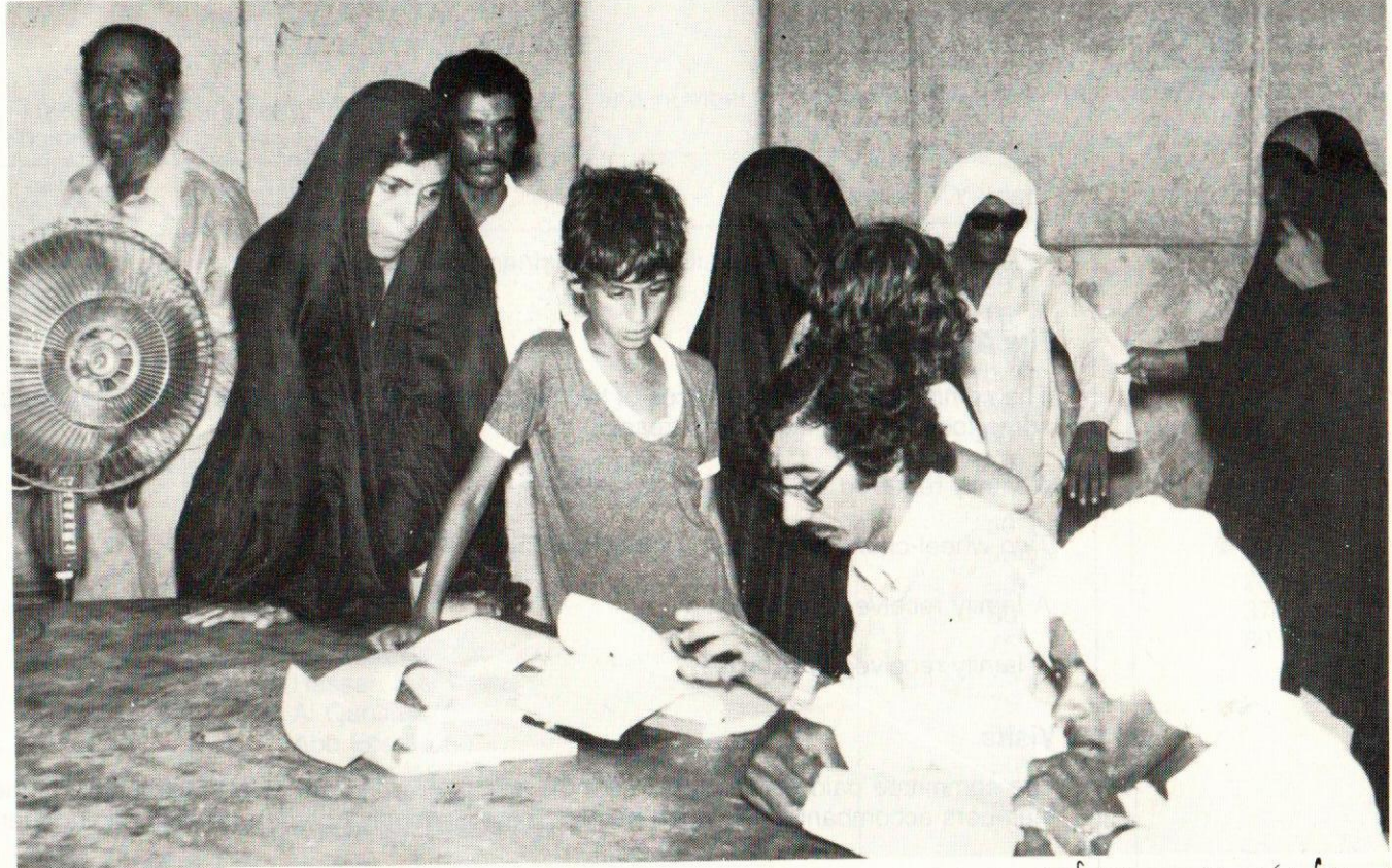
The Social Services Committee — helping the needy and the poor.

لجنة الخدمات الاجتماعية بالجمعية ننفذ رسالة الجمعية الإنسانية تجاه المواطنين والأسر المحتاجة.