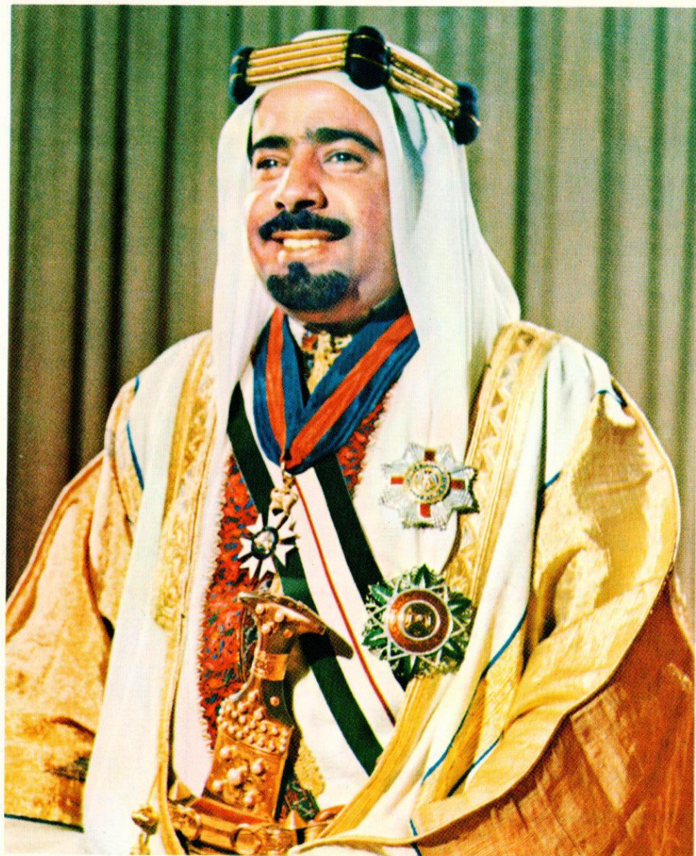
حضرة صاحب السمو الشيخ عيسى بن سلمان آل خليفة أمير دولة البحرين المعظم ورئيس شرف الجمعية