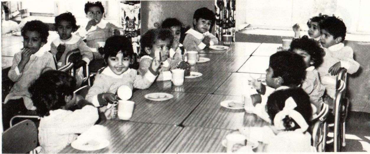
Another Baby Home was opened in Budaiya area on 15th Jan'79.

في ١٥ أيار تم افتتاح دار طفول ثانية تابعة لجمعية الهلال الأحمر البحريني بمنطقة البدع.