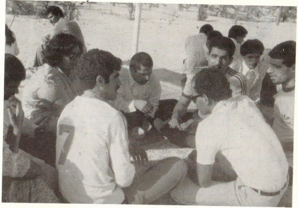
Health Education Committee — creating health education and awareness among citizens.

جانب من عملية التوعية التي تنفذها جمعية الهلال الأحمر البحريني وخاصة بين أهالي قرى البحرين .