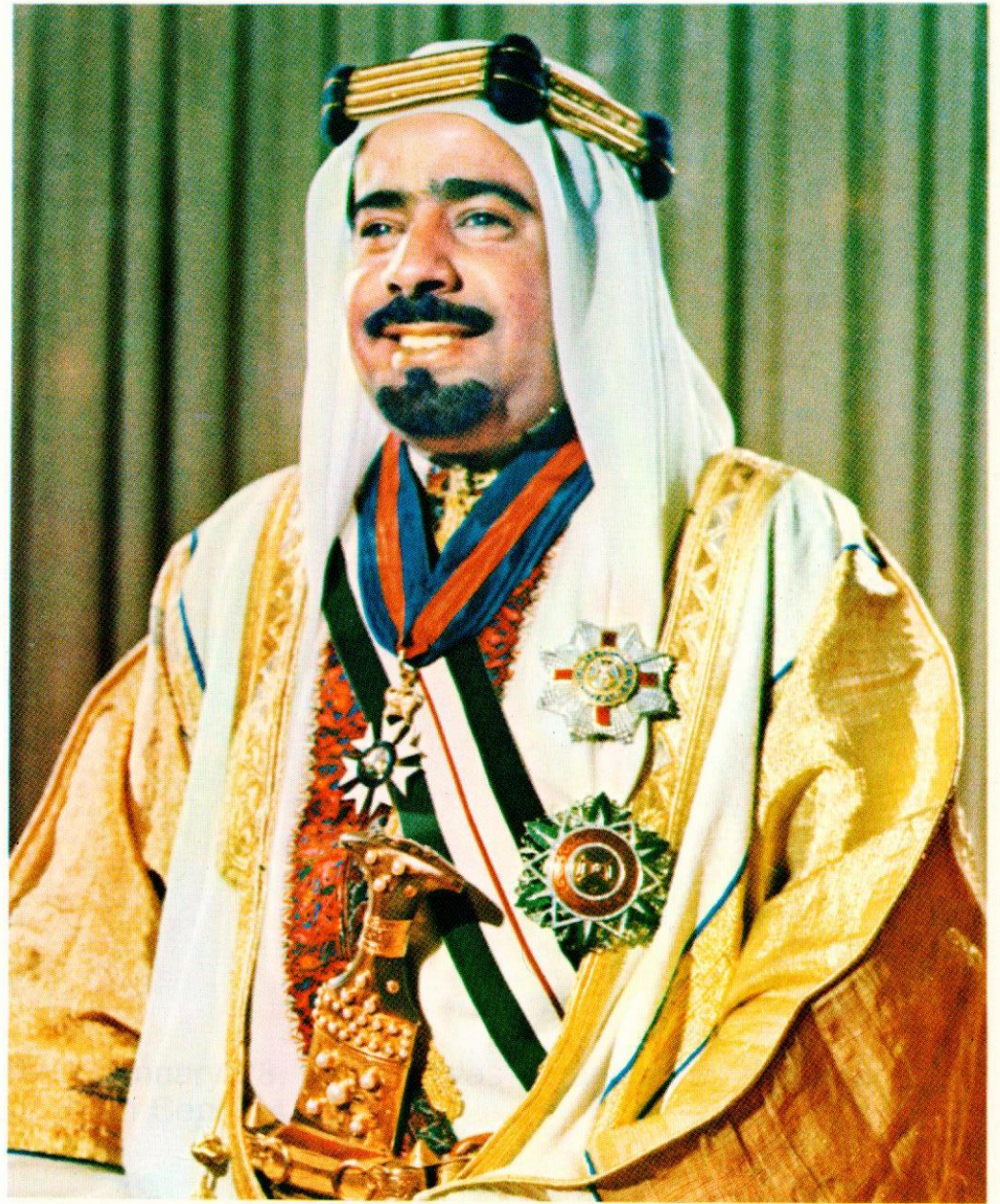
His Highness Shaikh Isa Bin Sulman Al Khalifa, Amir of the State of Bahrain and Hon President of the Bahrain Red Crescent Society