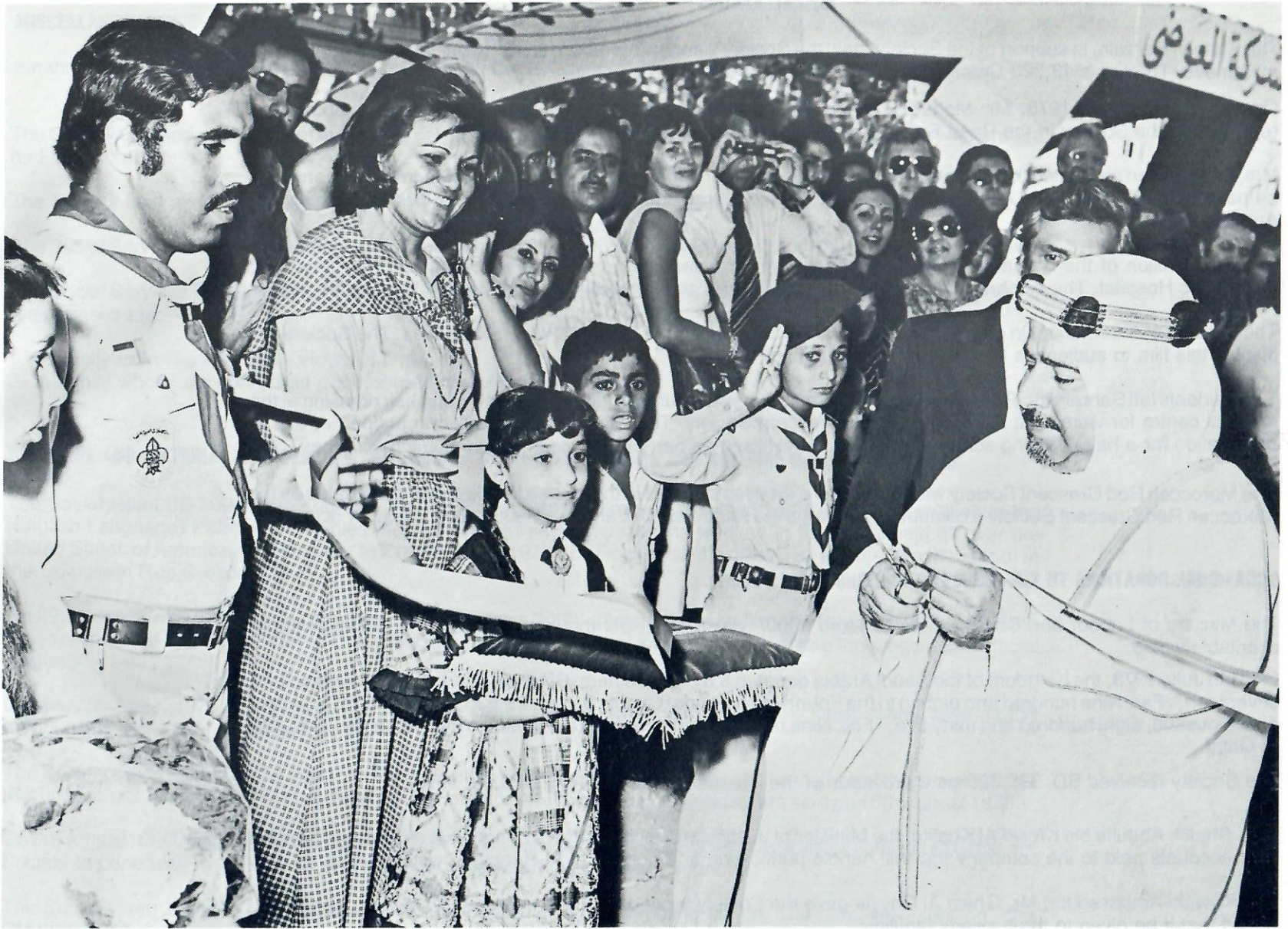
His Highness the Amir opening The Fourth International Charity Bazaar in April 1978.

سمو الامير المعظم يفتتح السوق الخيري الدولي الرابع في ابريل ١٩٧٨ •