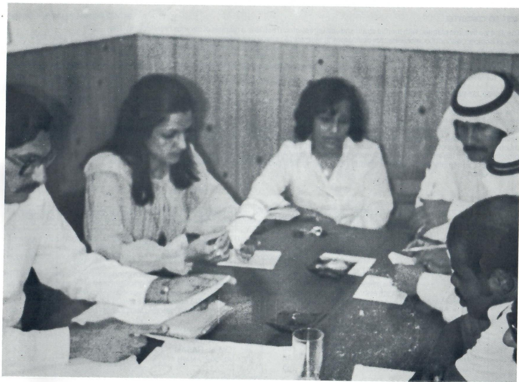
The Public Relations Committee, in conference.

• لجنة العلاقات العامة في أحد اجتماعاتها •