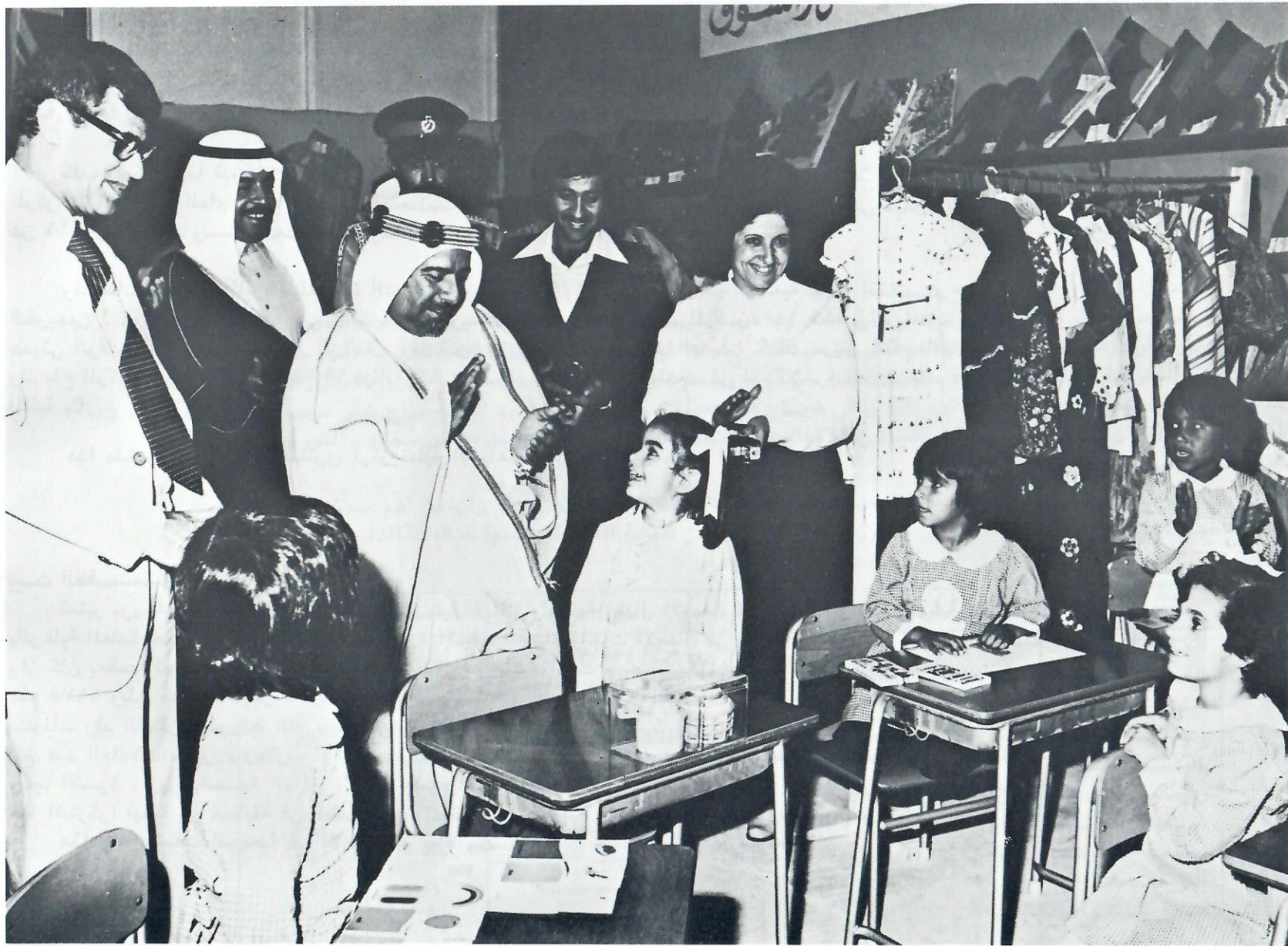
His Highness the Amir visiting The Baby Home section of the Fourth International Charity Bazaar.

سمو الامير المعظم يتفقد جناح دار الطفل بالسوق الخيري الدولي الرابع