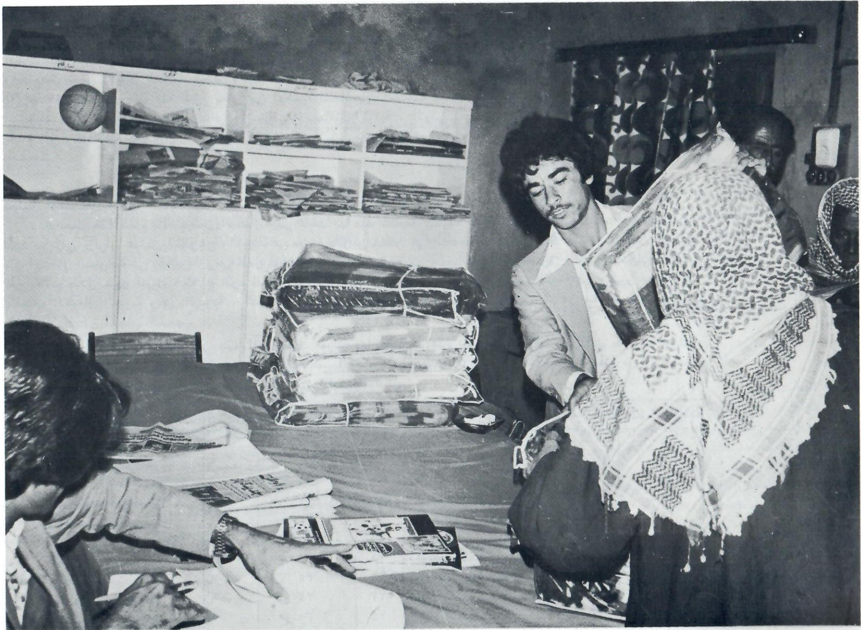
Members of the Social Services Committee distributing blankets; a seasonal aid for the needy.

• اعضاء لجنة الخدمات الاجتماعية يوزعون البطانيات على الاسر الفقيرة •