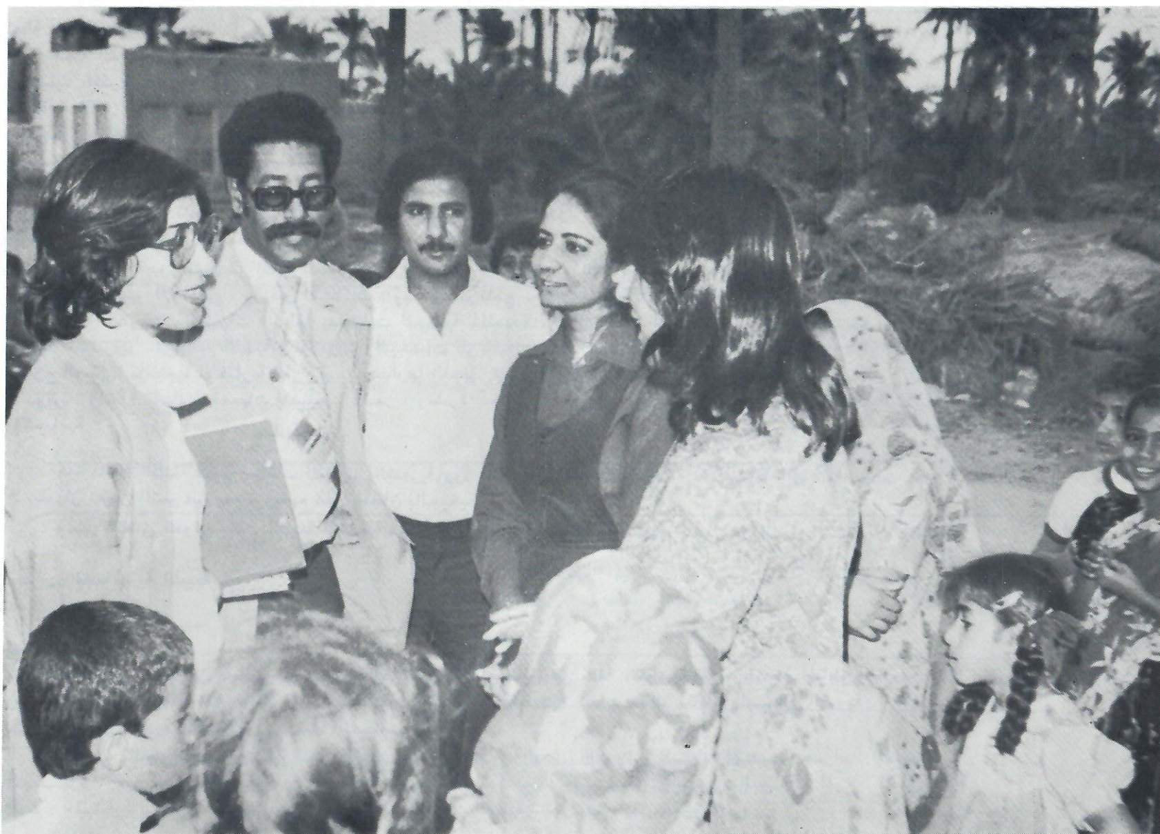
Members of the Society meet village health workers.

اعضاء من الجمعية يجتمعون بمجموعة من العاملين في احد المراكز الصحية بالقرى .