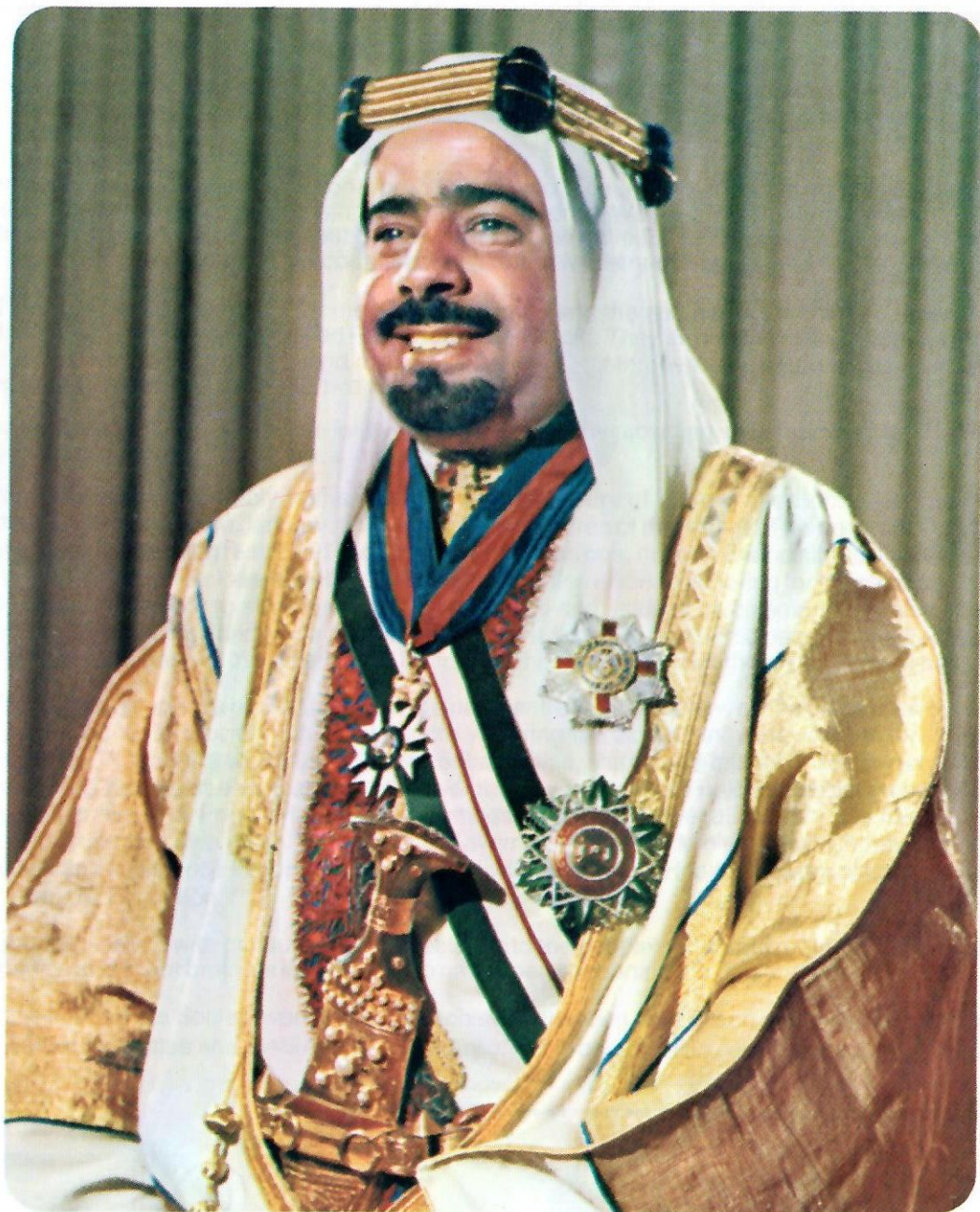
H.H. SHAIKH ISA BIN SULMAN AL-KHALIFA Amir of the State of Bahrain

Patron and Honorary President of the Bahrain Red Crescent Society