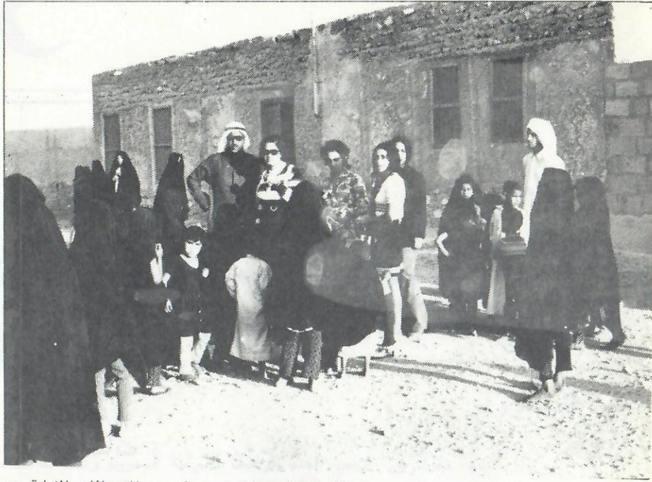
■ الدفعة الخامسة من خريجي الاسعافات الاولية ..