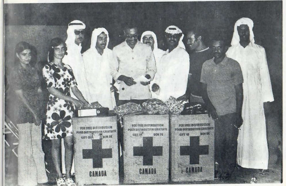
■ استلام هدية من كندا وهى من الملابس مختلف الاحجام ..