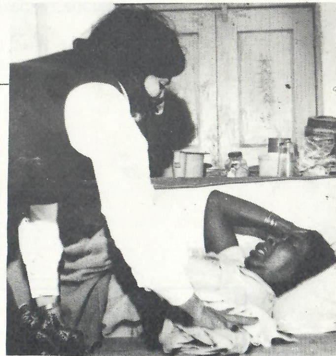
One of the Society members presenting an aged woman a present during the Eid.

The leader of the old aged unit is visiting one of the aged woman at home.