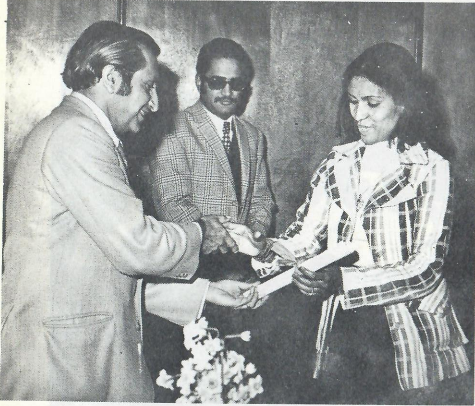
■ رئيس جمعية الهلال الاحمر البحريني يسلم احدى خريجات مركز الخياطة