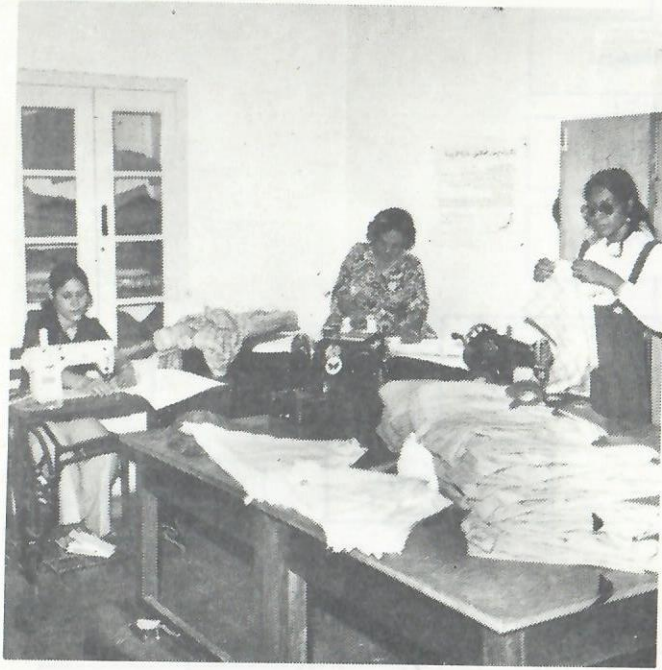
■ عضوات لجنة المشغل وهن يقمن بالخياطة والتطريز ..